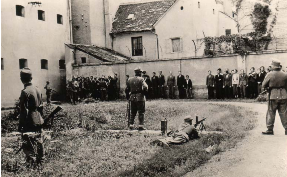
Das Münchner Polizei-Bataillon 72 ermordet die Eltern der geraubten Kinder in Celje im Sommer 1942.