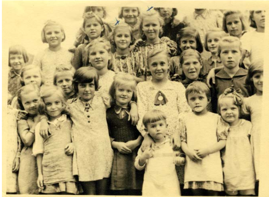
Alleine 1100 geraubte Kinder, die in Bayern als Geisel inhaftiert waren.