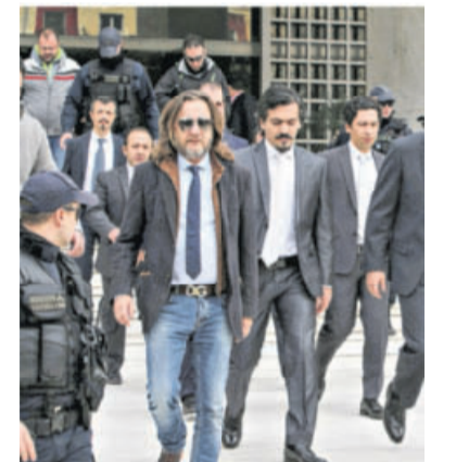
Begleitet von griechischen Sicherheitsbeamten verlassen die Soldaten das Gericht.

Nach Angaben des Bundesinnenministeriums vom Oktober haben allein in Deutschland 35 türkische Diplomaten und Familienangehörige Asyl beantragt. Die Türkei verlangt ihre Auslieferung. Gerd Höhler